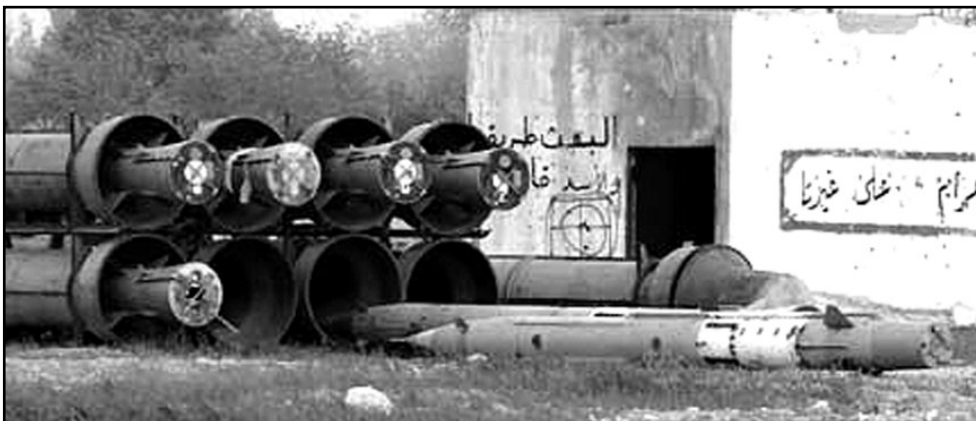
SVZ am 14.04.2013: Aufklärungsfoto von "Experten" aus Syrien. An diesem Ort sollen Reste des chemischen Kampfstoffes "Sarin" gefunden worden sein!! Das sind aber Transportbehälter mit Fla-Raketen 20D des Fla-Raketenkomplexes S-75. Die Triebwerke dieser Raketenstufe arbeiten in einer Komponente mit einem aggressiven und giftigen Flüssigtreibstoff, genannt "Samin". Das sind aber keine einsetzbaren Chemiewaffen. Braucht man wieder einen Vorwand zum militärischen Eingriff? BK